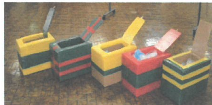
段ボール箱 2個で作った 手作りのカラフルな ダンボールトイレ