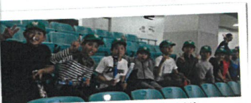
名古屋ドーム観戦